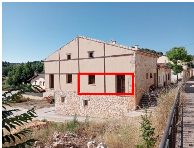
Vivienda en la calle Gregoria Arranz 9; 1º izquierda.