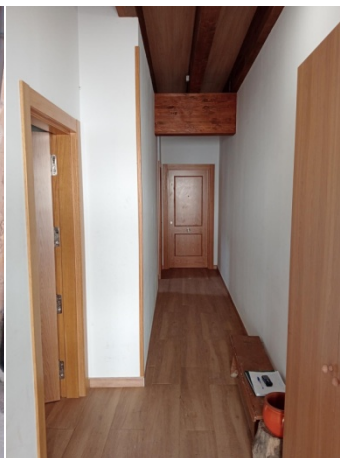
Hall de acceso común.