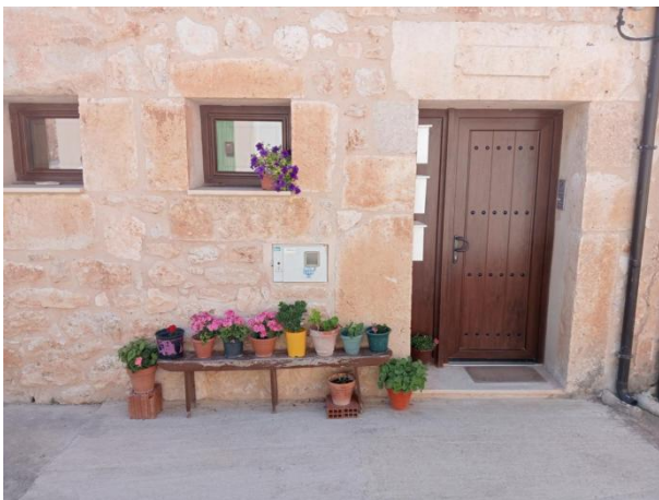
Entrada a las viviendas.